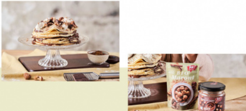
Palatschinken-Torte mit Nougatcreme-Füllung und Maroni-Topping